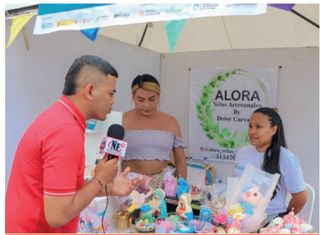
Expo+ Feria de Emprendimientos - Norte de Santander

De igual forma, promovimos espacios para que las unidades productivas y emprendimientos vinculados a nuestros proyectos fortalecieran sus capacidades comerciales y ampliaran sus redes de contacto y comercialización. Entre estos escenarios se destacan la Clausura Primera Cohorte Zasca Lácteos, la Clausura Primera Cohorte Zasca Manufactura, la Clausura Segunda Cohorte Zasca Lácteos, el Encuentro de Mujeres Artesanas, la Expo+ Feria de Emprendimientos y Mujeres Emprendedoras en Acción.