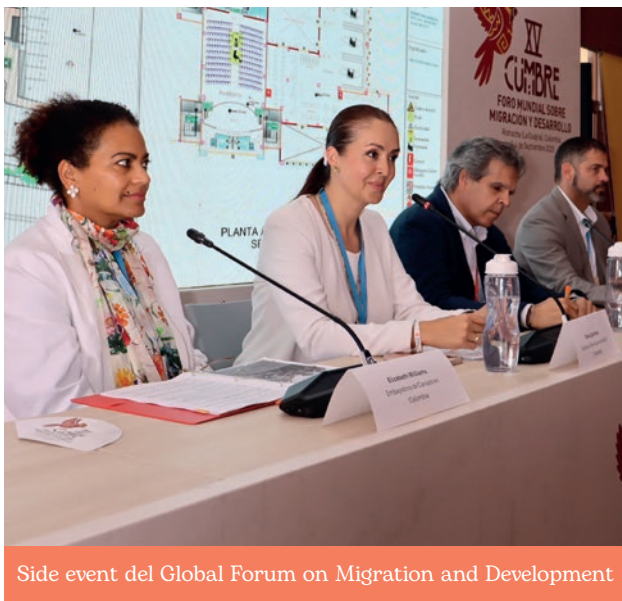
Side event del Global Forum on Migration and Development

Con el propósito de fortalecer el relacionamiento institucional y visibilizar nuestra experiencia y modelos de intervención, participamos en escenarios de alto nivel como la Cumbre del Clima Colombia y LATAM, la Cumbre UE-CELAC, ImpactMinds, el lanzamiento del Informe de Arraigo Colombia, el side event del Global Forum on Migration and Development (GFMD) y la socialización del Manifiesto del Cuidado. Estos espacios permitieron presentar los resultados, aprendizajes y apuestas de Ayuda en Acción Colombia en temas de desarrollo, movilidad humana, sostenibilidad y equidad, entre otros.