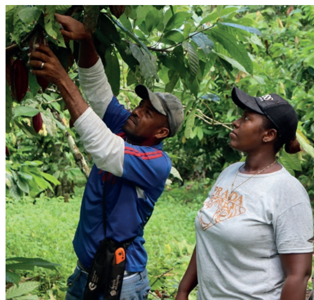
Productores de cacao en Tumaco