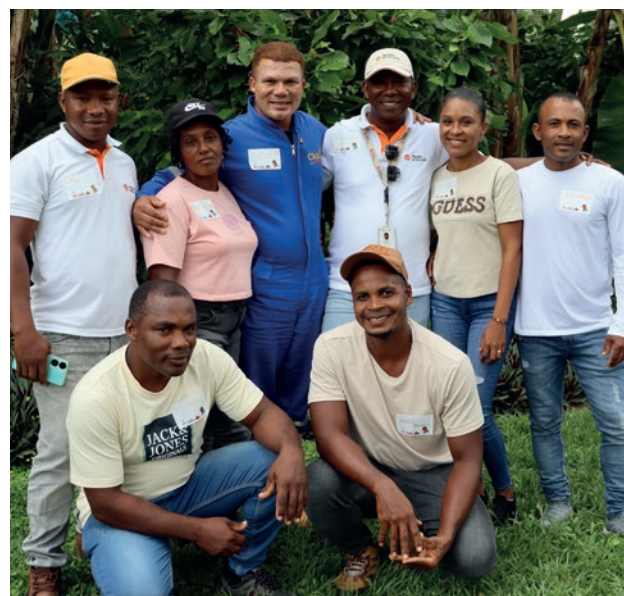
Visita a la Granja Luker - Santagüeda, Caldas

Casa Luker: En el marco del convenio Cacao para la Paz, se desarrolló una semana intensiva de formación técnica en la Granja Luker dirigida a líderes cacaoteros y equipos técnicos, fortaleciendo capacidades productivas, estándares de la calidad del cacao y competencias para el acceso a mercados especializados.