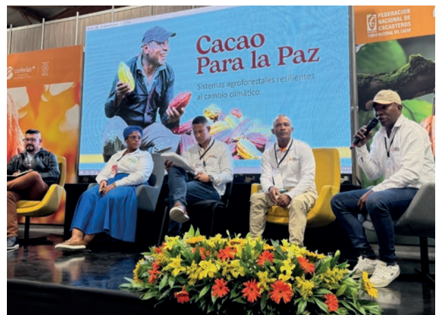
ChocoShow 2025 - Bogotá D.C.

Finalmente, fortalecimos el posicionamiento del proyecto Cacao para la Paz y las oportunidades de visibilidad y comercialización de las organizaciones productoras participantes mediante la asistencia a eventos especializados como CacaoFest, ChocoFest, ChocoShow 2025 y el Festival Cacaotero de Palmira, escenarios que contribuyeron al reconocimiento del cacao como motor de desarrollo económico y construcción de paz en los territorios.