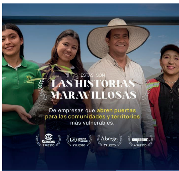
Ganadores del Premio Emprender Paz 2025

Se avanzó en acciones conjuntas orientadas a apoyar a asociaciones cacaoteras de Tumaco en el cumplimiento de la Regulación Europea sobre Productos Libres de Deforestación (EUDR), fortaleciendo procesos de trazabilidad, sostenibilidad y acceso a mercados internacionales.